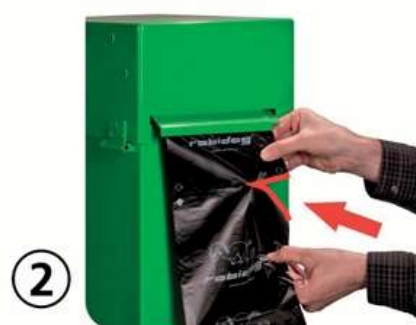
Oben halten, Unten abreissen