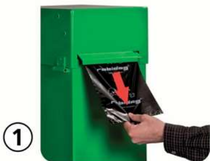
Beutel gerade herausziehen

Bitte beachten Sie beim Entnehmen der Beutel, dass Sie dies bis zum Nächsten herausziehen und beim Abreissen diesen festhalten. Ansonsten zieht man zu fest und der Beutel reisst im Innern des Behälters ab. Dann muss der Behälter für die nächste Entnahme geöffnet werden.